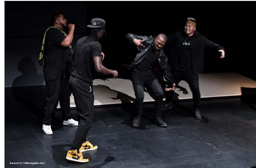
Trailer Alpha Krump

Cliquer sur une des images pour accéder à la vidéo