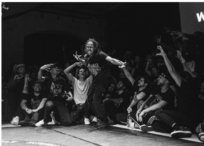
IIB 2023 Documentaire

En 2023, sept qualifications ont permis à des danseur.ses internationaux.ales de se qualifier directement pour la finale du INTERNATIONAL ILLEST BATTLE : Japon, Inde, Espagne, Allemagne, Kazakhstan, France (Lille) et en ligne.