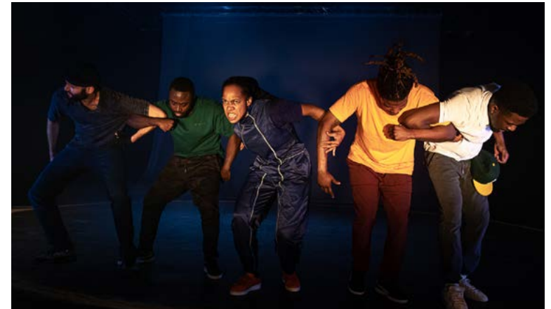
Trailer A Human Race

Ce spectacle est produit par L'OFFENSIVE TANZ für junges Publikum (L'offensive Danse Jeune Public). Cette structure berlinoise questionne la scène artistique, institutionnelle et éducative, et s'appuie sur des recherches universitaires pour développer, produire et promouvoir en Allemagne et en Europe des créations chorégraphiques innovantes à destination du "jeune public" (à savoir des spectateurs entre 1 à 18 ans).