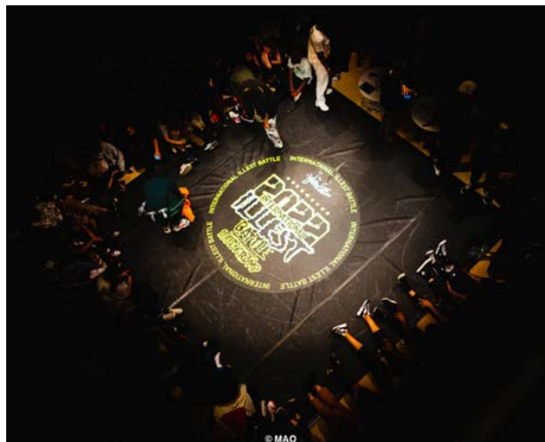
IIB 2023 - finale highlights