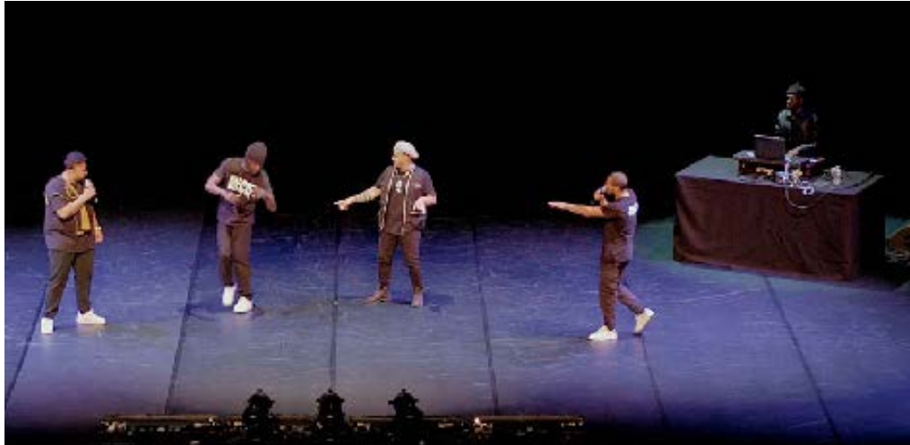
Captation À ne pas diffuser

Cliquer sur les image pour voir les vidéos